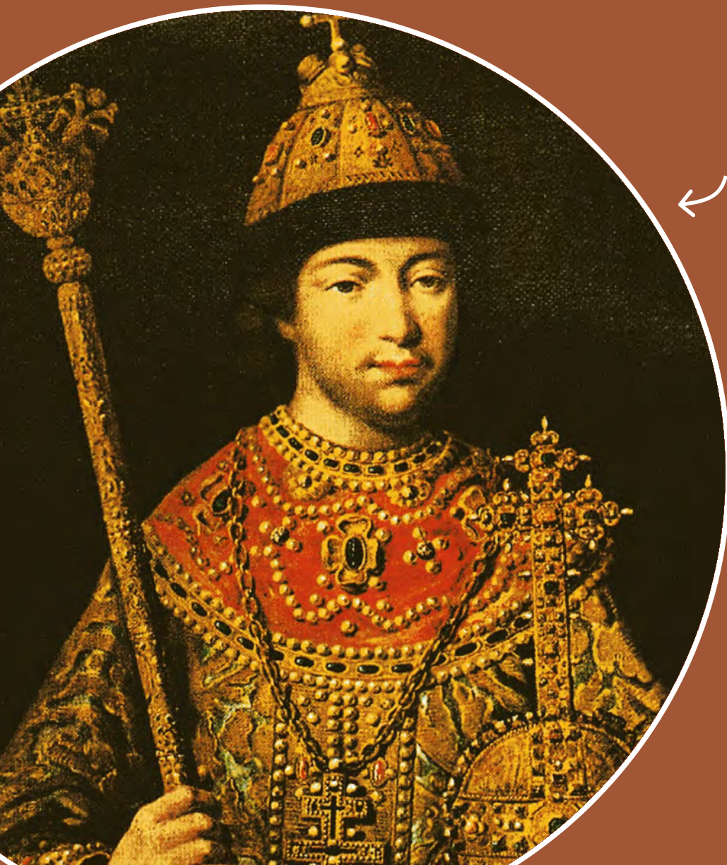
← Юный Михаил Фёдорович Романов