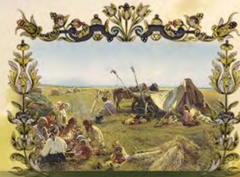
РОССИЯ – КОРМИЛИЦА ЕВРОПЫ