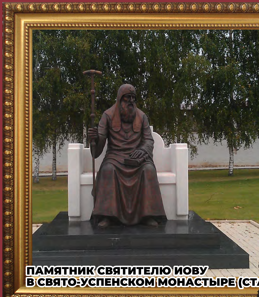
ПАМЯТНИК СВЯТИТЕЛЮ ИОВУ В СВЯТО-УСПЕНСКОМ МОНАСТЫРЕ (СТАРИЦА)