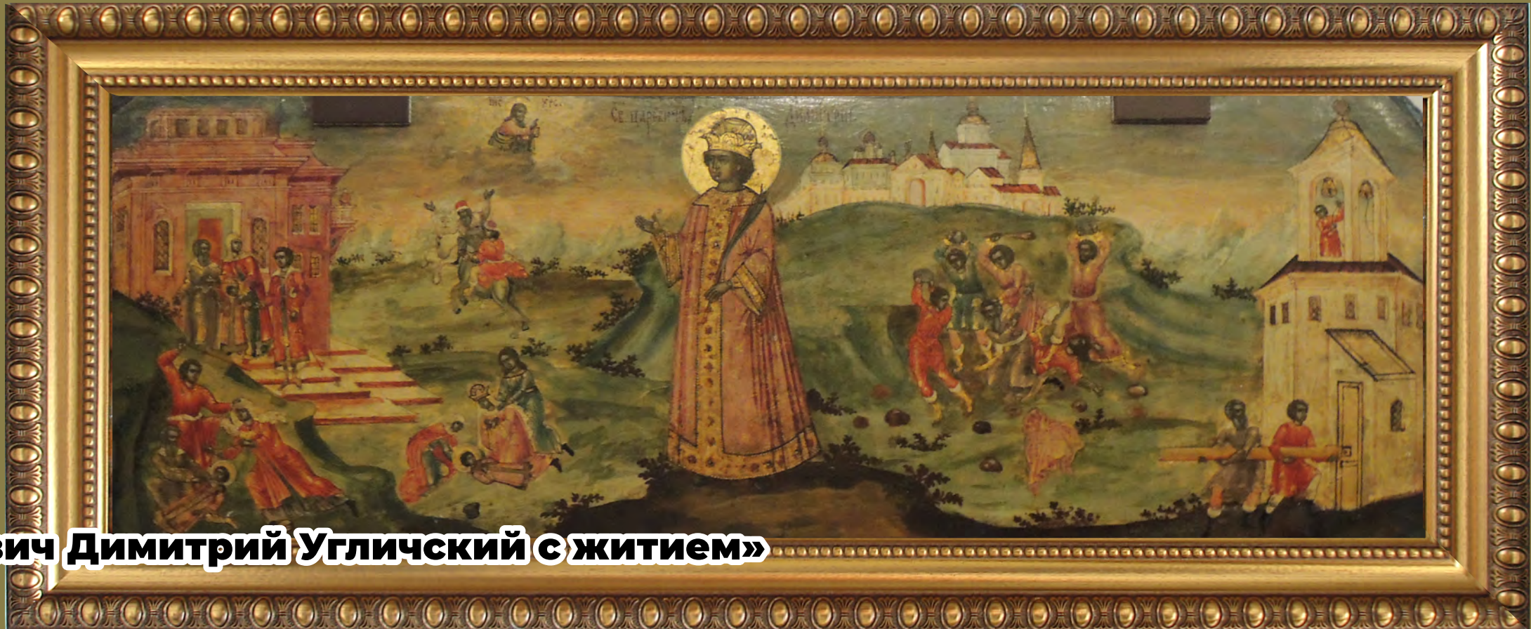
«Царевич Димитрий Угличский с житием»

В Российском царстве назревал династический кризис – царь был бездетен, а его младший брат 8-летний царевич Дмитрий погиб при загадочных обстоятельствах в Угличе в 1591 году.