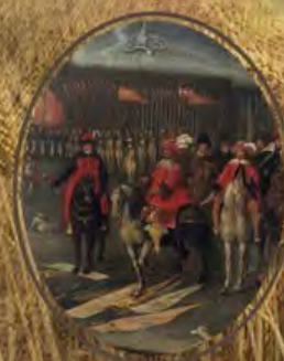
СМОЛЕНСКАЯ ВОЙНА 1632–1634