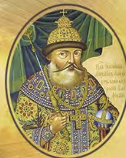
ЦАРЬ И ПАТРИАРХ