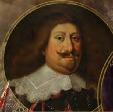
Сигизмунд III и Владислав IV