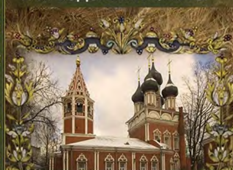
УТВЕРЖДЕНИЕ НОВОЙ ДИНАСТИИ