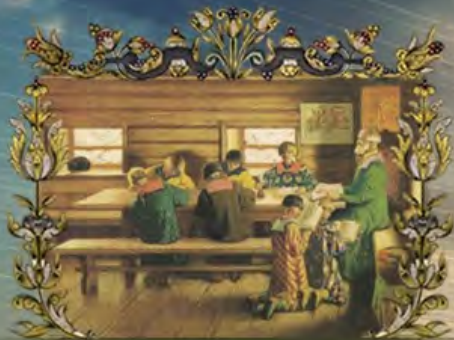
РАЗВИТИЕ ОБРАЗОВАНИЯ И ПЕРВЫЙ БУКВАРЬ