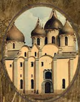
МИР СО ШВЕЦИЕЙ И ВОЗВРАЩЕНИЕ НОВГОРОДА