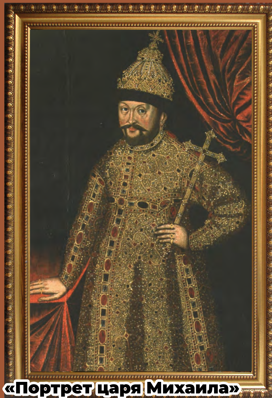
«Портрет царя Михаила»