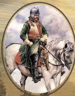
ПОЛКИ НОВОГО СТРОЯ