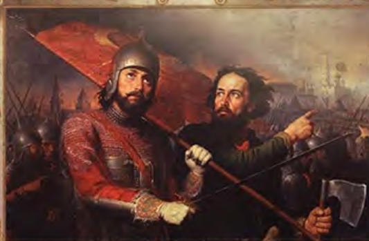
Дмитрий Пожарский и Кузьма Минин