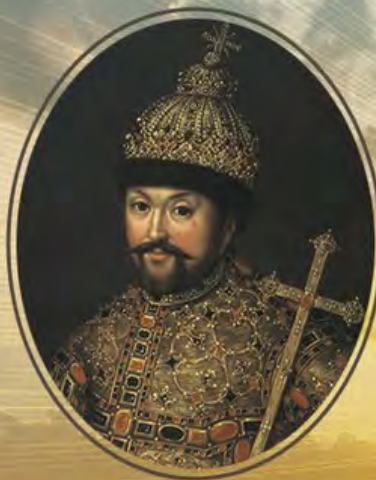
МИХАИЛ ФЕДОРОВИЧ ГОДЫ ЦАРСТВОВАНИЯ: 1613–1645