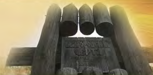
УКРЕПЛЕНИЕ ЮЖНЫХ РУБЕЖЕЙ